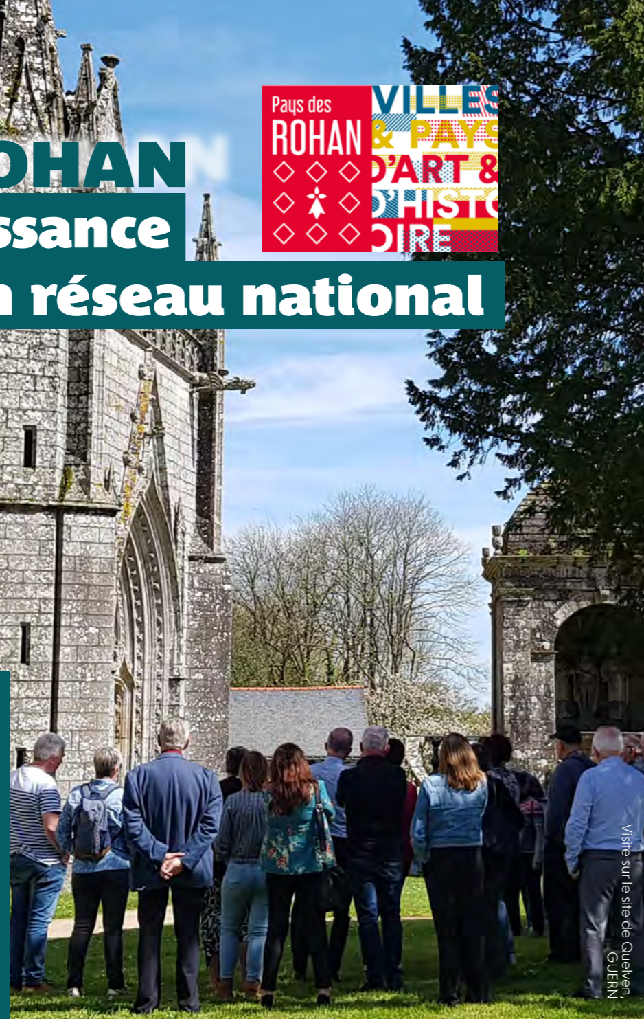
Visite sur le site de Quelven, GUERN

Elle souhaitait ainsi mettre en avant l'engagement de l'intercommunalité vers un projet culturel de territoire et valoriser la dynamique mise en place avec l'obtention du label Pays d'art et d'histoire.